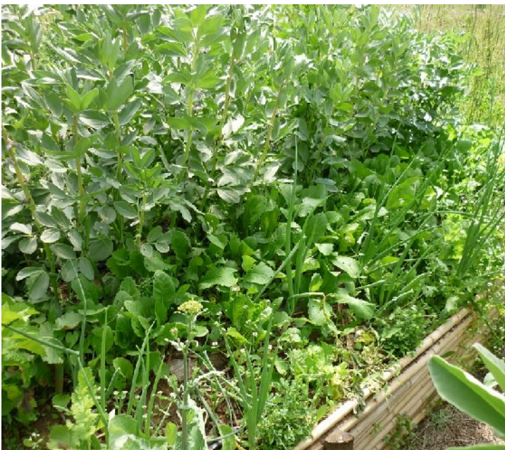
XXXX photo 160 : Navets semés dans la bande intermédiaire. Au dessus on voit des fèves dans la bande de sommet en dessous des oignons dans la bande extérieure.