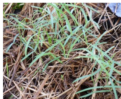
XXXX photo 153 : Apparition des jeunes pousses de vesce qui pour le moment n'ont pas de « vraies » feuilles de vesce. Elles apparaîtront par la suite (voir photo 57 pXX).