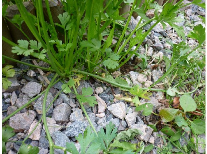
XXXX photo 143 : Visiblement on pourrait même utiliser des petits cailloux comme en témoigne ce persil qui s'est abondamment semé lui-même dans cette allée.

Le BRF pourrait convenir à condition que les plaquettes ne soient pas plus large que 1 cm, sinon les plantules n'arriveront pas à les contourner. Le BRF est un matériau plus serré que le BREFT fin.