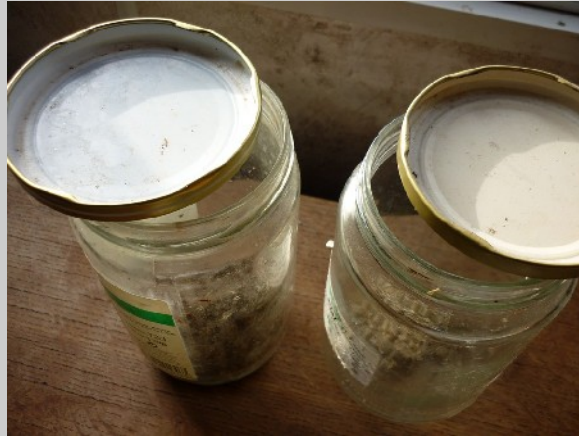
XXXX photo 147 : Le couvercle est simplement posé à cheval sur l'ouverture du bocal.

Après un trempage d'une nuit, l'eau et les graines sont versées dans un chinois. Après un bon égouttage, le chinois est renversé au dessus du bocal pour y remettre les graines. Le bocal permet de maîtriser facilement l'humidité autour des graines comme on le fait pour les graines germées en cuisine. Il peut être utile de rincer à nouveau les graines au bout de quelques jours. Attention ne fermez pas complètement le bocal, les échanges de gaz doivent avoir lieu avec l'atmosphère et la température ne doit pas augmenter.