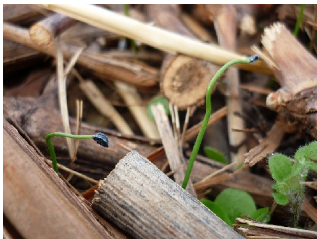
XXXX photo 154 : oignons