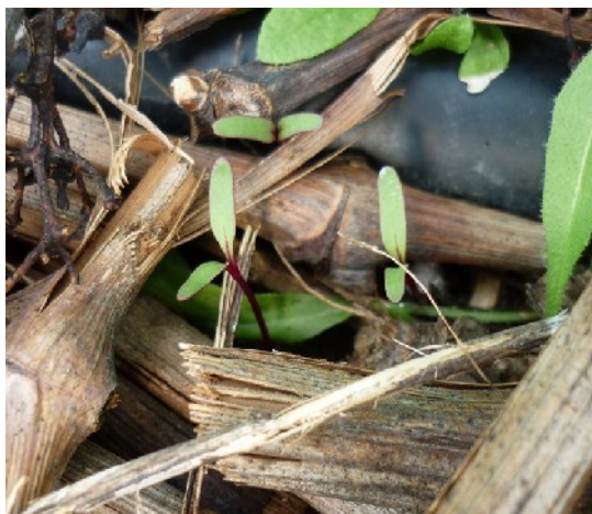
XXXX photo 155 : betteraves