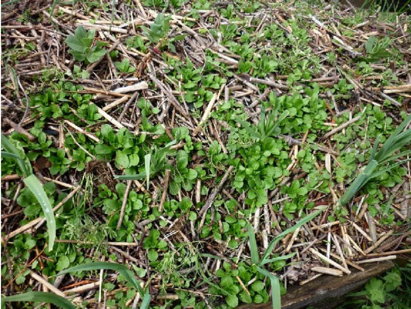
XXXX photo 157 : Mâche semée en surface dans une couverture de BREFT fin. Notez comme le niveau d'enherbement est très faible.