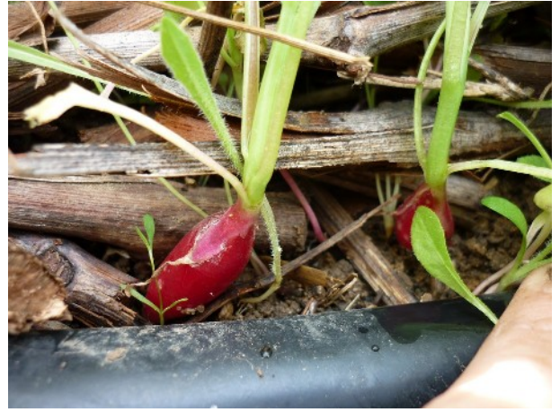
XXXX photo 159 : Bien que semée en surface cette variété longue de radis s'est développée correctement.