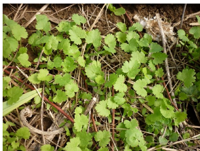
XXXX photo 162 : Le panais réussis très bien en semis de surface (même en janvier avec du gel). Voir aussi photo 42 p XX.