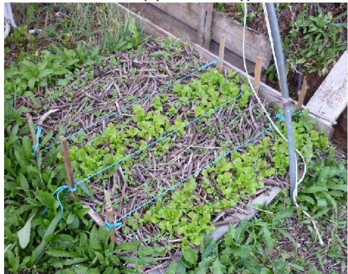
XXXX photo 137 : Semées en surface, les salades de cette pépinière se développent normalement.

On peut respecter les mêmes dates et conditions de température que le semis enterré, avec en plus l'avantage d'avoir plus de facilité avec les semis très précoces de début d'année (panais) du fait qu'il n'est pas utile de préparer un sol encore difficile à travailler à cette époque de l'année.