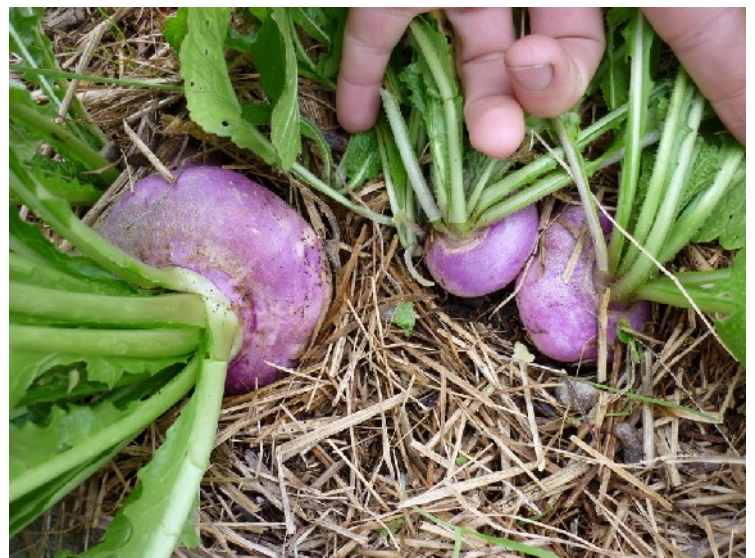
XXXX photo 161 : Ces navets n'ont pas eu de défauts de croissance visibles en étant semés en surface.