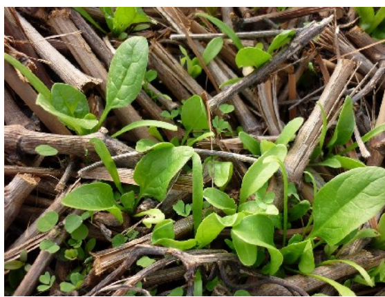
XXXX photo 158 : Apparition du second stade de développement des épinards avec les premières vraies feuilles.