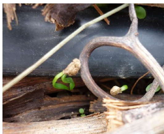
XXXX photo 136 : Jeunes pousses de salade traversant une couverture de BREFT fin.