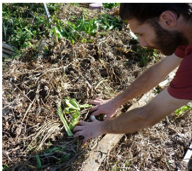
XXXX photo 151 : Semis de vesce, elle peut être semée au travers d'une couverture grossière de 2 à 3 cm d'épaisseur.